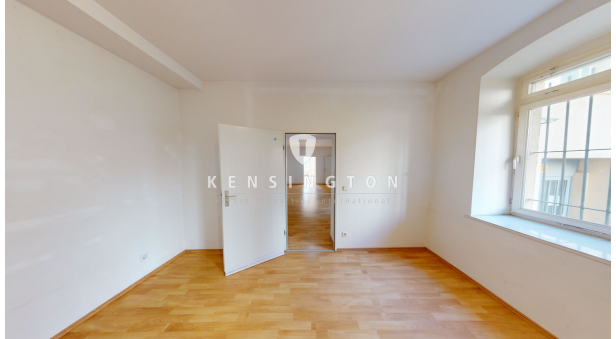
Zimmer zum Hinterhof