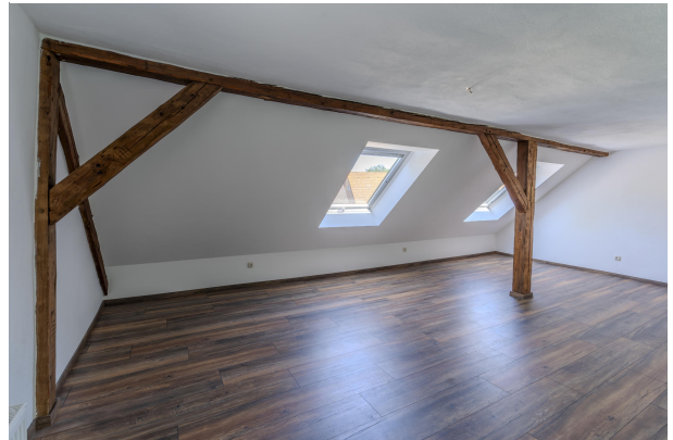
2. OG Wohnung Schlafzimmer