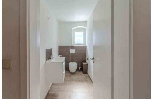
1. OG Wohnung Gäste WC