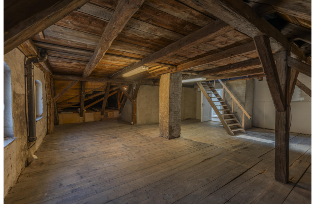
2. OG Ausbaupotenzial