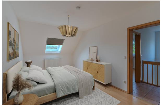
Gemütlich und ruhig!