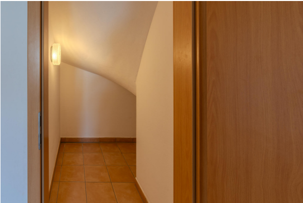
Praktischer Stauraum unter der Treppe!