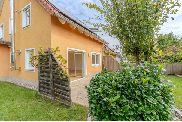
Ihre sonnige DHH!