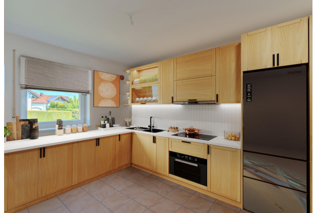
Einrichtungsbeispiel neue Küche!