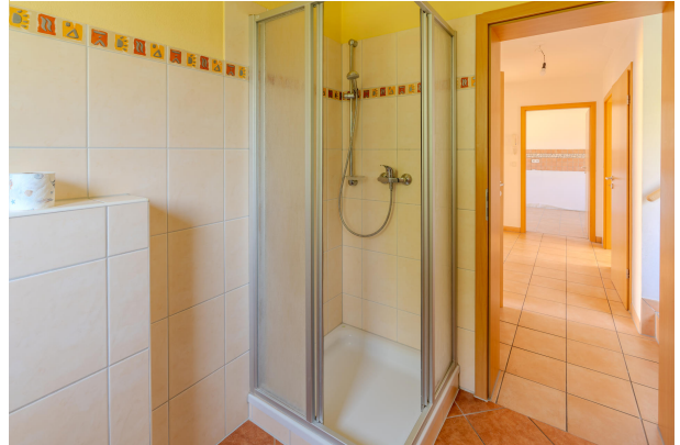
Inklusive Dusche im EG