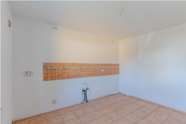
Zur individuellen Gestaltung!